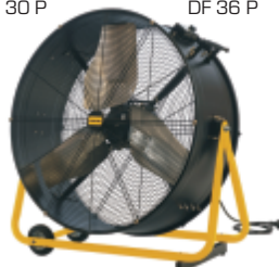
DF 36 P

Tyto profesionální ventilátory nabízí robustní konstrukci, nastavitelný proud vzduchu, otáčení 360 stupňů a model DF20P nabízí rotaci 360 stupňů horizontálně i vertikálně. Model DF20P můžete pověsit na zeď nebo na strop. Oba modely mají specifický směr proudění vzduchu a najdou využití v různých provozech. Zlepšují proudění a cirkulaci vzduchu.