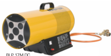
BLP 17 M DC

Tato plynová topidla s ručním piezo zapalováním umožňují provoz topidla zcela nezávisle na napájecí elektrické síti po dobu delší než 8 hodin. Lithiovou 3 Ah / 14,4 V baterií lze od topidla snadno odpojit a dobít. Provoz je možný i standardní cestou pomocí elektrického síťového adaptéru. Baterie je kompatibilní s akku BOSCH 14,4V příslušné řady.